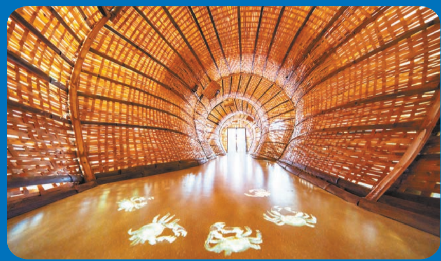
陽澄湖大開蟹文化館。