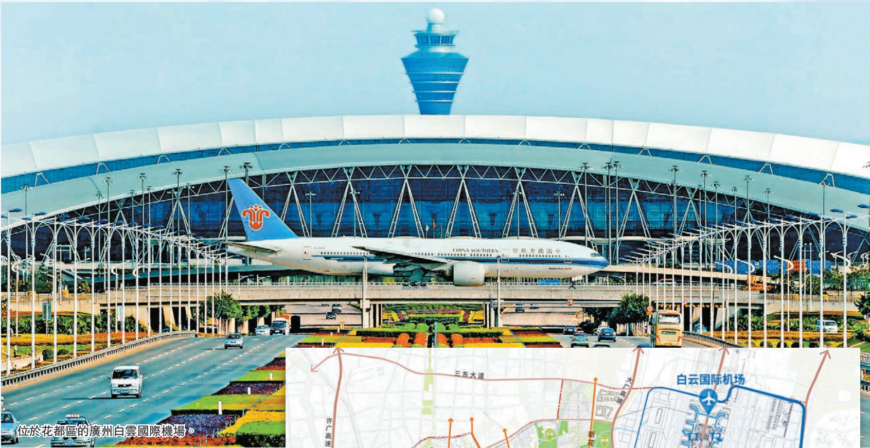
位於花都區的廣州白雲國際機場。

7月28日，廣州市花都區舉行2022年「空鐵新機遇 北部增長極」招商大會。此次活動，花都區接連放出大招，率先發布粵港澳大灣區《空鐵金廊·樞紐客廳》發展規劃，推出「智匯花都十條」人才政策，並為花都區認定的30名高層次人才頒發證書，向首批重點企業（項目）的24名優秀人才交付人才房鑰匙，彰顯花都廣聚英才的信心與決心；以現場簽約、視頻連線等方式集中展示74個項目簽約、84個投資項目動竣工的實況，項目總投資超2000億元。立足灣區頂點，搶抓空鐵機遇，釋放廣州發展北部增長極的強大勢能！ 賴小青