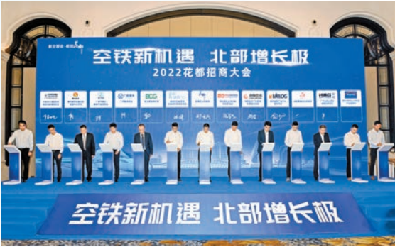
重點項目集中簽約儀式。

本次集中動竣工的項目共84個，預計總投資655億元，本年度計劃投資86.4億元。其中，京東亞洲一號廣州花都項目一期、廣東粵電花都天然氣熱電有限公司2×400MW級燃氣—蒸汽熱電聯產項目、南航綜合培訓中心、化妝品總部聚集區（花都湖片區）、廣州中遠海運空運白雲機場倉儲項目等32個項目宣布竣工；東風日產智能數字化工廠項目、九龍湖「灣區·中旅世界」、中國電建大灣區科