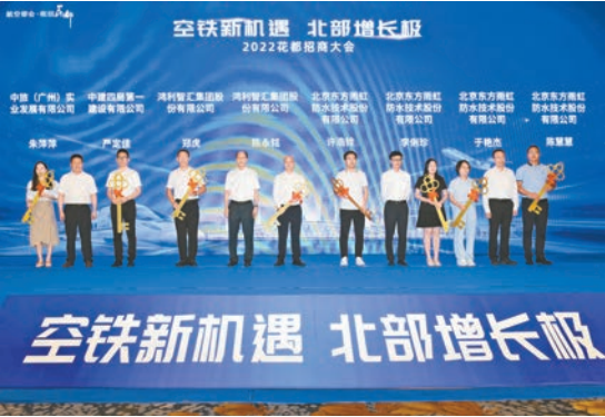
人才房交鑰匙儀式。

接下來，花都區將繼續在探索優化營商環境改革上幹實事，以此次招商大會為契機，進一步敞開合作與開放的大門，加快構建全區「一盤棋招商」和「一條龍服務」招商新格局，強化產業鏈招商、平台招商、專業招商、以商招商，吸引更多潛力大、成長性高的優質企業到花都投資發展，共同參與花都建設、感受花都速度、見證花都發展。