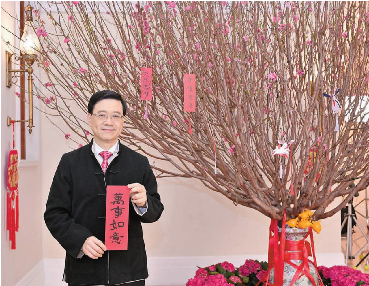
李家超認為香港多個產業都可以在中東覓得無窮機遇。