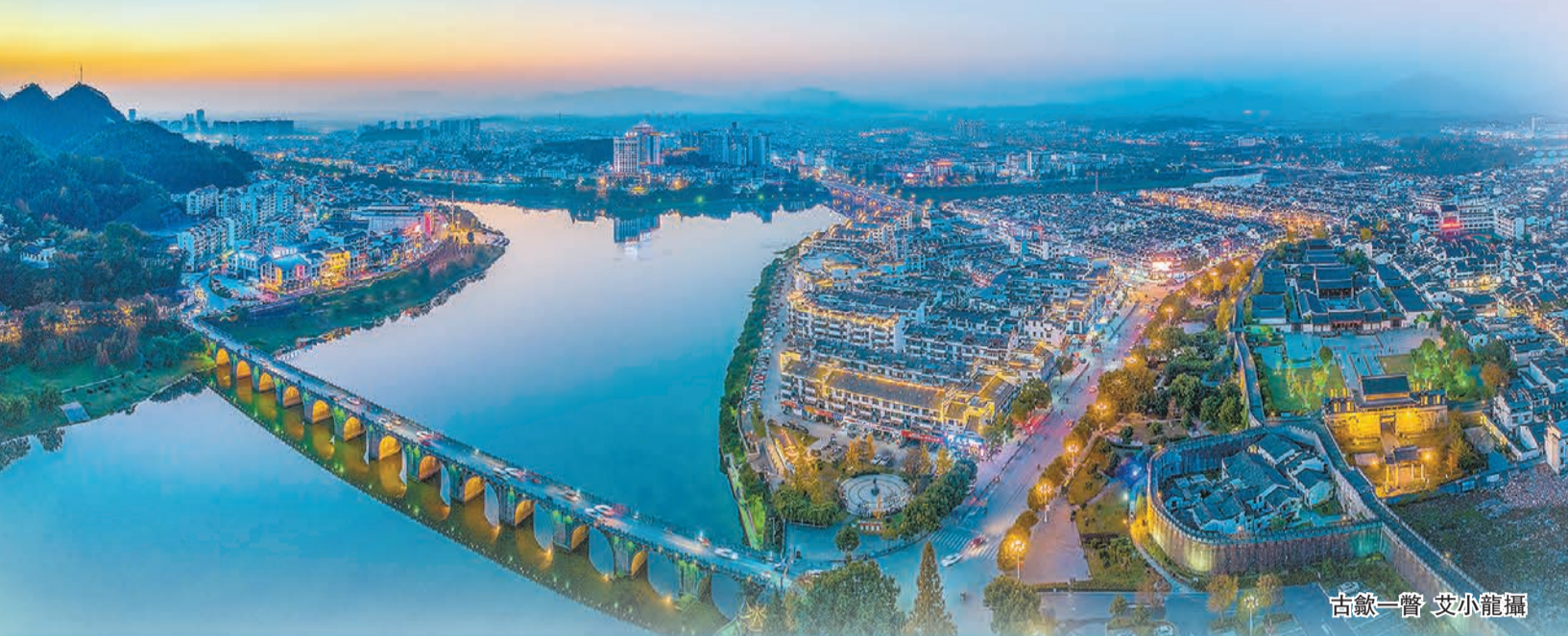
古歙一瞥