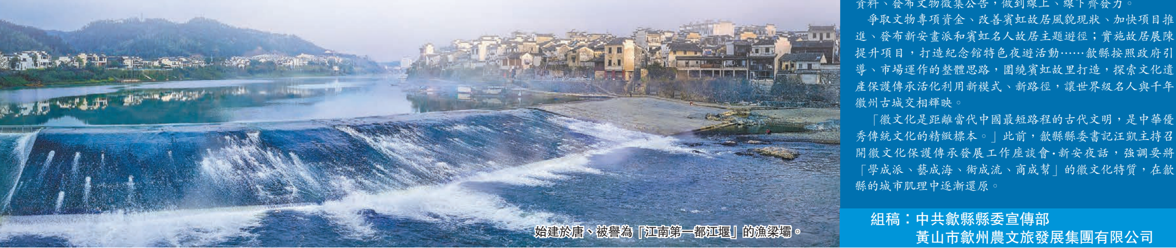
始建於唐、被譽為「江南第一都江堰」的漁梁壩。

「徽文化是距離當代中國最短路程的古代文明，是中華優秀傳統文化的精微標本。」此前，歙縣縣委書記汪凱主持召開徽文化保護傳承發展工作座談會，新安夜話，強調要將「學成派、藝成海、術成流、商成幫」的徽文化特質，在歙縣的城市肌理中逐漸還原。