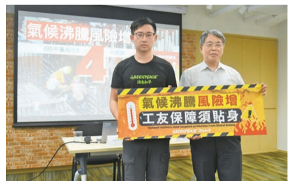
團體指《預防工作中暑指引》未能反映全港防壓力的地域差異。

【香港商報訊】記者林駿強報導：更新的《預防工作中暑指引》實行近三個月。環保團體綠色和平昨日公布，7月全港多區的建築工地外測量暑熱數據，發現各區的濕球黑球溫度（WBGT）存在極大差異，惟勞工處所制定的指引僅參考京士柏氣象站得出的數據，未能反映全港防壓力的地域差異，亦不能反映戶外工作者的暑熱風。團體促請政府盡快檢討指引，並作出多項建議，包括增加指引衡量熱壓力時的熱輻射數據比重並直接採用WBGT、政府部門應帶頭調整工程合約等。