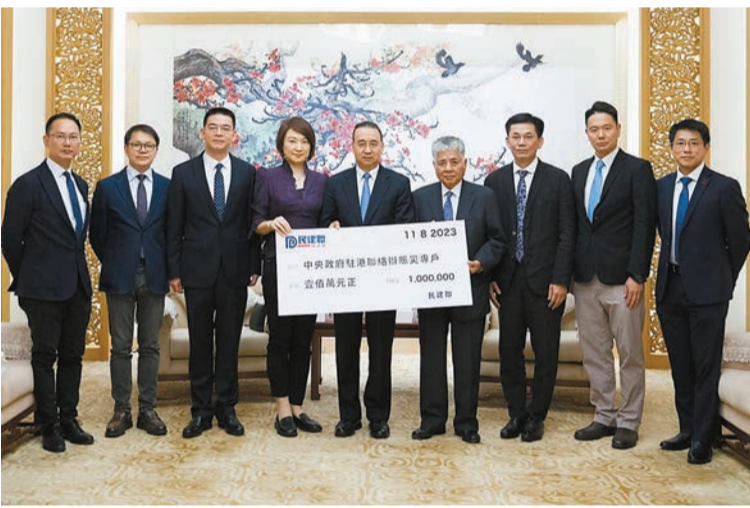
民建聯捐款100萬港元。