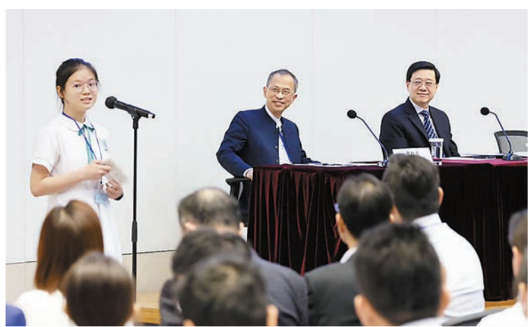
（右起）李家超及曾鈺成聆聽培僑學生分享感受。

民教育，讓學生從小了解祖國的歷史文化和國情，厚植家國情懷，加強他們的國民身份認同和民族自豪感，以及共同維護國家安全的意識。他期望香港教育界認真研讀及領會習主席回信的內容，把握核心要義，聯繫自身工作，共同為香港培養「可堪大任的棟樑之才」而努力。