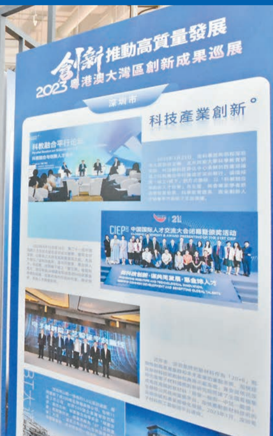
2023粵港澳大灣區創新成果巡展現場。