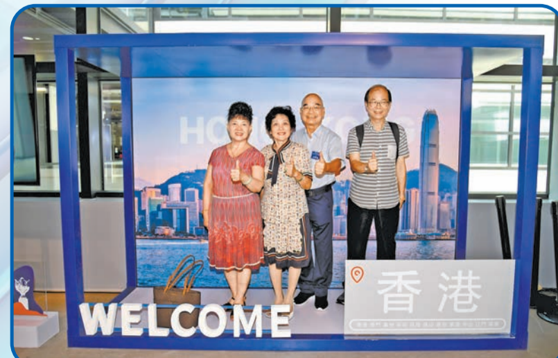
本港市民在打卡牆打卡。