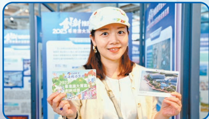
現場觀眾展示巡展明信片。