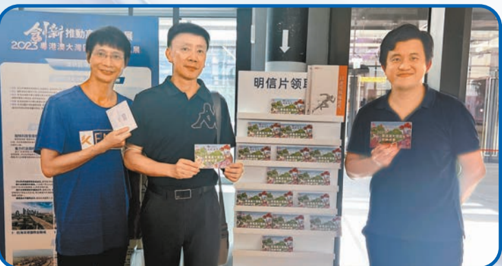
深圳集郵愛好者專程赴港觀展並領取明信片。

據悉，該公司正在積極布局落地香港，選址在香港中環或者香港科技園。王東介紹說：「目前觀安的香港公司正在積極籌備，整個觀安在全國有1200多名員工，是一間北京、上海及深圳三總部的公司。其中，85%的人員都是技術研發人員，三年的研發經費高達3.5億元人民幣，是一家提供「大數據+泛安全」產品與服務的高新技術企業。在數據安全、數據出境、網絡安全、5G安全、工業互聯網安全、人工智能安全等方向有深厚積累，因而相信觀安落地香港後亦能賦能政府單位、中資駐港企業、跨國公司及擁有內地業務的港資企業等不同類型機構企業的發展。」