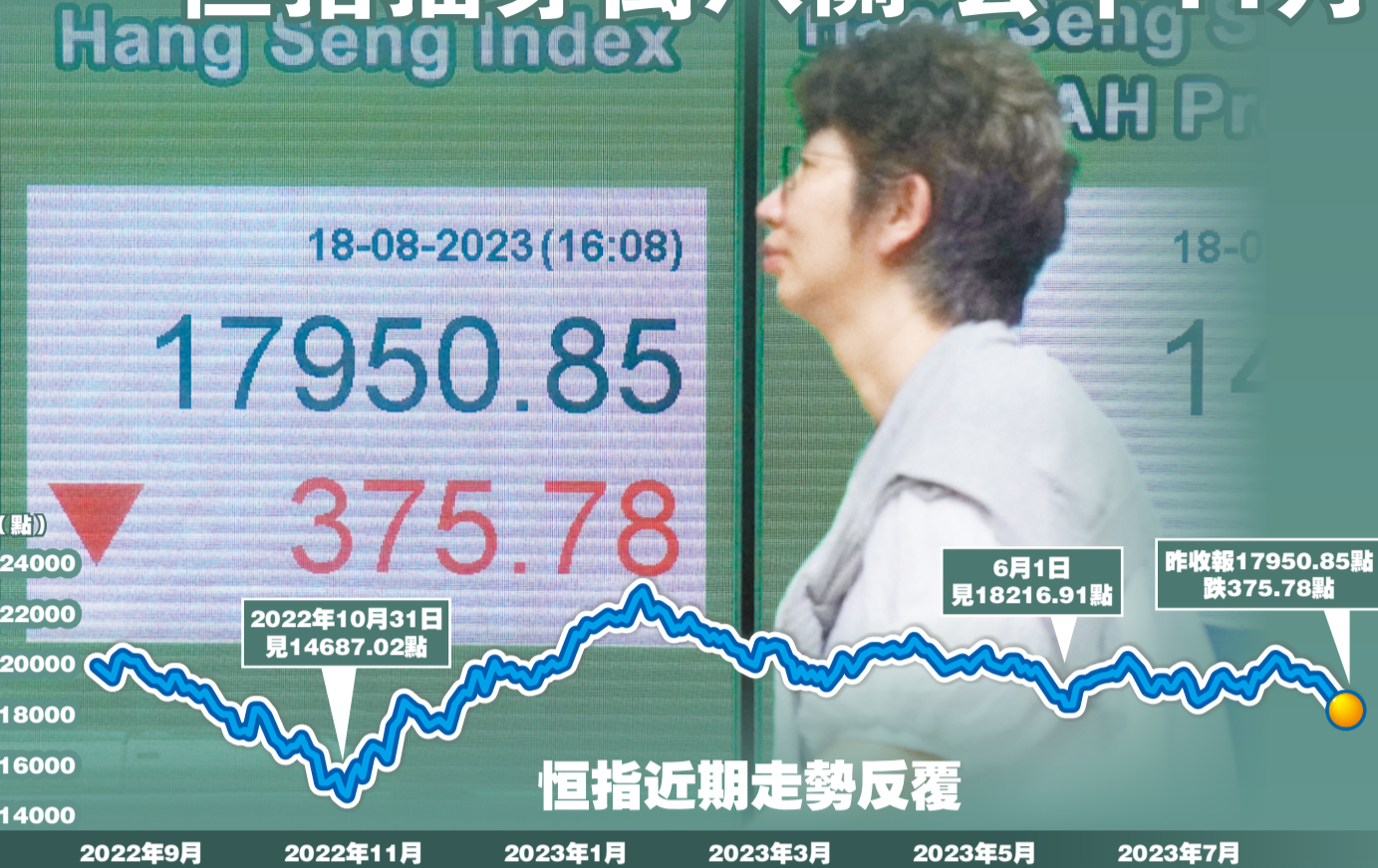
恒指近期走勢反覆