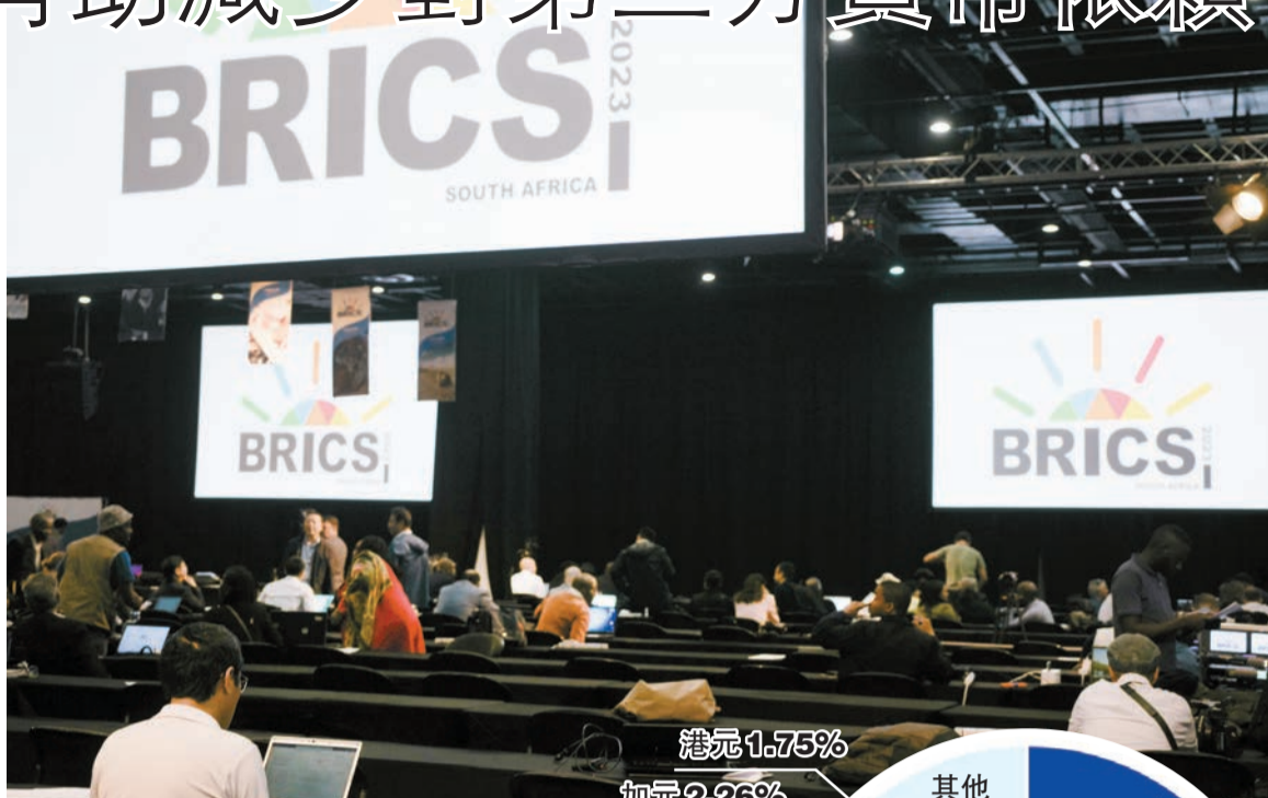
有分析認為，金磚國家間擴大本幣結算規模，將有助推動貨幣結算多樣化。

據彭博分析，「金磚十一國」目前GDP佔比已達到36%，而單計「金磚五國」就已佔全球GDP的32%，超越G7的30%；彭博估計至2040年，「金磚十一國」佔全球GDP再會進一步提升達45%以上。