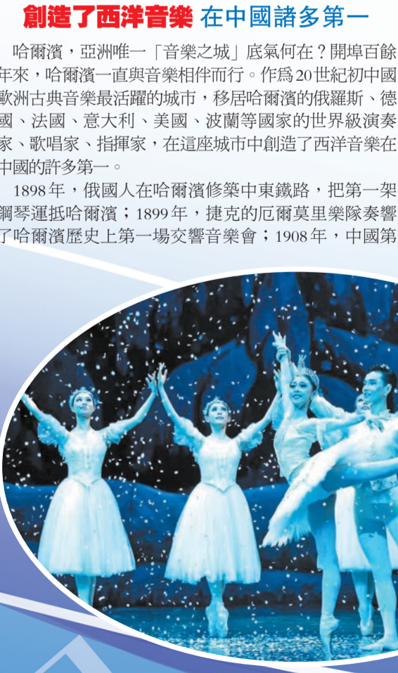
▲世界經典芭蕾舞劇《胡桃夾子》在哈爾濱大劇院上演。

一支交響樂團——哈爾濱第一交響樂團成立，上世紀20-30年代一度被譽為遠東第一交響樂團。同時，自1961年創辦以來，延綿半個多世紀的哈爾濱之夏音樂會已經成為中外聞名的越辦越好的音樂節，享譽國內外。 中國的「哈夏」世界之舞台 62載流金歲月，36屆音樂饕餮。讓我們把時針倒撥到62年前，傾聽一下「哈夏」滴答滴答一路走來的「年輪」之音。1961年，歷時11天，700餘名演員參與的首屆哈爾濱之夏音樂會，用優美而又振奮人心的旋律為哈爾濱城市文化發展掀開新的歷史篇章。此後的62年，哈爾濱人的音樂血脈在「哈夏」的一屆屆發展中持續積澱。在哈爾濱市委、市政府的精心主辦下，每一屆「哈夏」都獨具匠心。「哈夏」點燃了中國音樂新長征的火種，對推動全國音樂藝術發展具有重要意義。 從1996年第23屆開始，「哈夏」音樂會提檔升級，步入一個新的發展里程碑，改由國家文化部和哈爾濱市人民政府共同舉辦，「哈夏」從地方性音樂活動升級為國家級音樂盛會；第24屆「哈夏」音樂會，開幕當天1380米紅毯迎賓入城；第26屆「哈夏」音樂會，來自意大利、英國、美國、波蘭、日本、奧地利、俄羅斯的音樂家進行了精彩演出，「哈夏」在國際化的道路上不斷拓展；第29屆「哈夏」音樂會，全國聲樂比賽落戶哈爾濱；第30屆「哈夏」音樂會，首屆國際手風琴藝術周成功舉辦；第32屆「哈夏」音樂會，助非爾德國際弦樂比賽首次落戶冰城……張權、郭頌、李谷一、盛中國、鄭小瑛等著名歌唱家、指揮家，莎拉·布萊曼、理乍得·克萊德曼、祖賓·梅塔等國際巨星、音樂家、指揮大師都曾在「哈夏」舞台上展風采，中國的「哈夏」已成為世界的舞台。 今年的7月27日，哈爾濱市十六屆人大常委會第十一次會議表決通過了關於設立哈爾濱音樂日的決定：自2023年起，每年的8月6日為哈爾濱音樂日。從第24屆「哈夏」音樂會以來，8月6日便是「哈夏」音樂會固定的開幕日期，25年來，這一日期已經深深刻在哈爾濱市民腦海裏，同時也是國內外音樂界和音樂愛好者對「哈夏」的難忘記憶。「哈爾濱城市音樂日」的設立，進一步提升了哈爾濱浪漫「音樂之城」的影響力和吸引力，讓世界「音樂之城」永葆青春活力。 以音樂之名 赴一場「冰城夏都」之約 今年「哈夏」音樂會有何亮點？值得一提的是，其開幕式文藝演出以專業化、多元化、國際化為突出特點，採用「交響+」的形式，通過《歌飛山水間》《啟動大舞台》《情深向未來》三篇篇章，將交響樂與聲樂、芭蕾舞、國內外特色樂器、電聲樂隊等其他藝術形式融為一體，以音、詩、畫、歌等豐富的藝術形式，唱響「強國建設、民族復興」的精神樂章。 「在我小的時候，是聽那首《太陽島上》認識哈爾濱，並對這座城市充滿嚮往。」首次擔任哈爾濱之夏音樂會開幕式總導演的保利文化集團股份有限公司藝術總監、北京保利演出有限公司董事長周濤在接受記者採訪時表示，因此前多次擔任「哈夏」開幕式主持人，再次回到「哈夏」舞台，有一種老朋友的重逢感。 談及對這座音樂之城的印象，周濤說：「哈爾濱是一座非常洋氣的城市，也是中國最早跟國外進行交流的城市，具有包容性和國際性，這裏的人們音樂欣賞水準很高。」