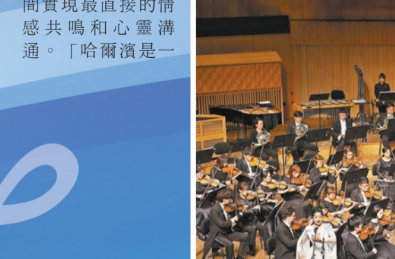
▶第十五屆全國聲樂展演。