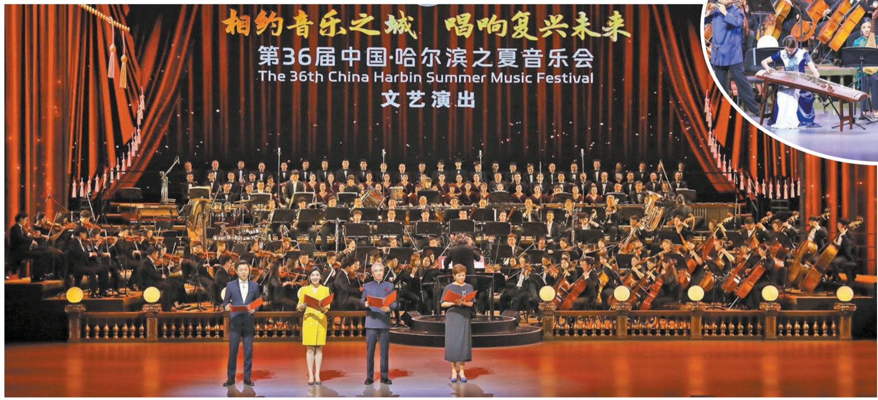
▲第36屆中國·哈爾濱之夏音樂會開幕式文藝演出現場。

今年，由文化和旅遊部、哈爾濱市人民政府主辦的第36屆中國·哈爾濱之夏音樂會，以「相約音樂之城 唱響復興未來」為主題，堅持「國家級水準、國際化特色、群眾性參與」的辦節方針，按照「政府主導、市場化運作、社會參與」的模式，以禮讚強國建設、唱響民族復興為着力點，突出「打造品牌、參與廣泛、形式多樣、內容豐富」的特點，積極促進專業演出與群文活動有機結合、文化與旅遊深度融合。 「我們來到了太陽島上……」悠揚的旋律是那般熟悉，8月26日晚，一首全新編曲的《太陽島上》從電視屏幕裏「流淌」出來，讓廣大市民重溫20天前在哈爾濱大劇院舉行的第36屆哈爾濱之夏音樂會開幕式精彩文藝演出，共赴這場美妙經典的音樂饕餮盛宴。當晚，世界經典芭蕾舞劇《胡桃夾子》作為本屆「哈夏」音樂會的重要演出之一，也在哈爾濱大劇院精彩上演，着實為「音樂之城」添加了一抹別樣的童話色彩。 「哈夏」音樂會作為中國舉辦時間最長、屆次最多的國家級音樂藝術活動，已經深深融入了這座城市的血脈。本屆「哈夏」音樂會共設開幕式演出、全國性展演活動、中外經典系列演出、全國專業音樂學院教學成果展示、群眾文化活動、「東亞文化之都」城市特色非遺展示活動、「冰城夏都」時尚文化展示活動7大板塊，向世界展現了亞洲唯一獲「音樂之城」殊榮城市的深厚音樂文化底蘊。