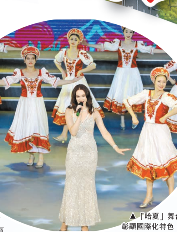
▲「哈夏」舞台 彰顯國際化特色。

座充滿着音樂律動的城市，一路進哈爾濱，就能感覺音樂的聲音無處不在，真是一段美妙的旅行。」來自杭州的遊客說。