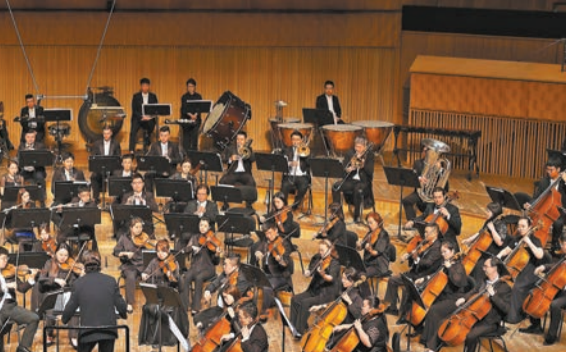
▶第十五屆全國聲樂展演。