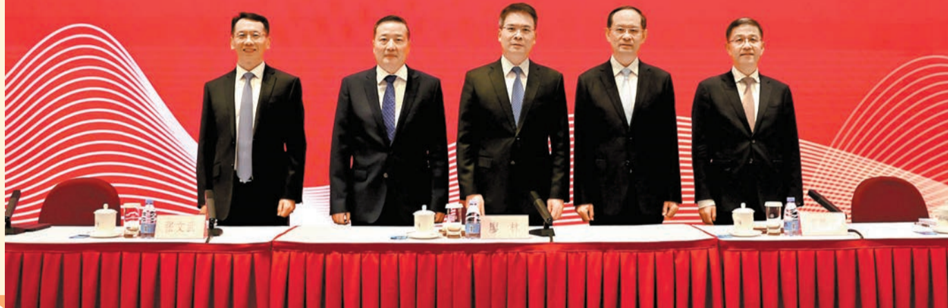
工行上半年純利1737億元再成為同行之冠。