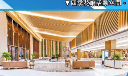
▼四季花廳活動空間。

年，泰康正式投資拜博口腔，目前泰康拜博已在北京、上海、廣州、深圳等近50個城市開設近160家專業口腔醫療機構。