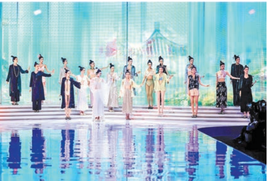
內衣發布秀現場。

【香港商報訊】記者伍敬斌報道：4 月 19 日，2024 中國內衣文化周暨第 19 屆中國國際品牌內衣展帶着全新的主題「樂起東方 匠新致尚」於深圳會展中心(福田)開幕，眾多行業領軍企業參與，優選品牌同台亮相。