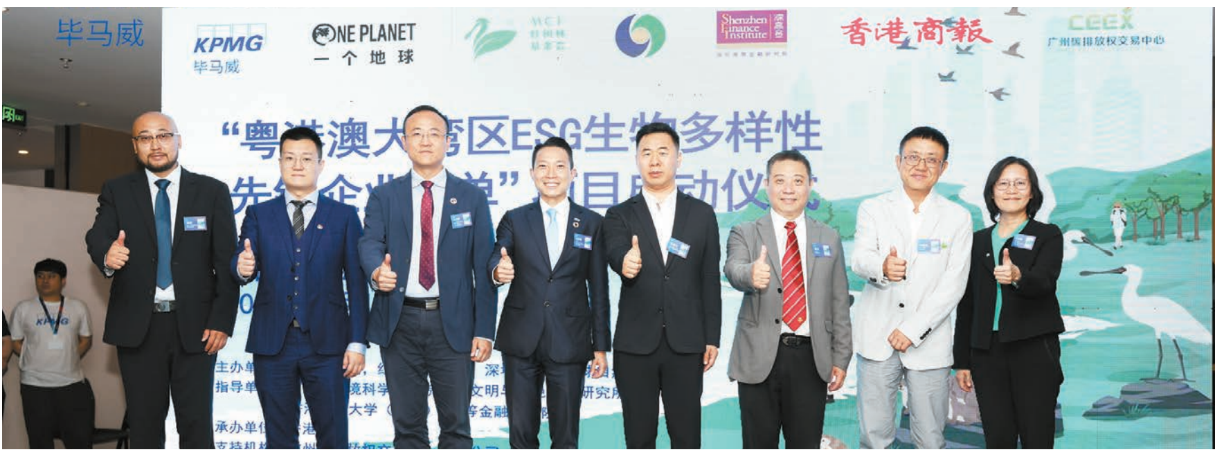
眾多嘉賓參與啟動「粵港澳大灣區 ESG 生物多樣性先鋒企業榜單」活動。